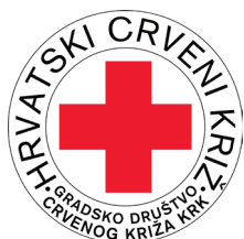
Gradsko društvo Crvenog križa Krk