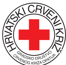
Gradsko društvo Crvenog križa Opatija