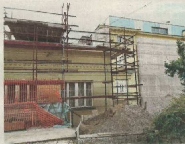
Značajan dio hotela Kvarner opasan je skelama

Od srpnja do rujna, dakle, u glavnoj sezoni je tvrtka pak