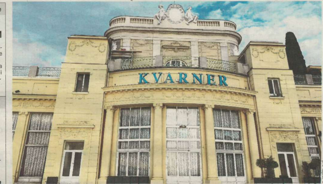
Ornamenti na fasadi najstarijeg hotela na Jadranu obnovljeni su, a radovi traju i dalje