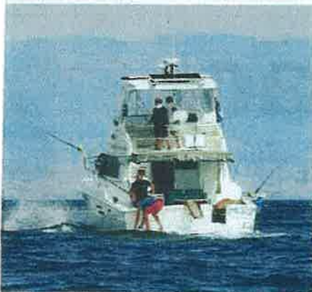
...umu od stotinjak kilograma nadmudrila ... »Mare II«