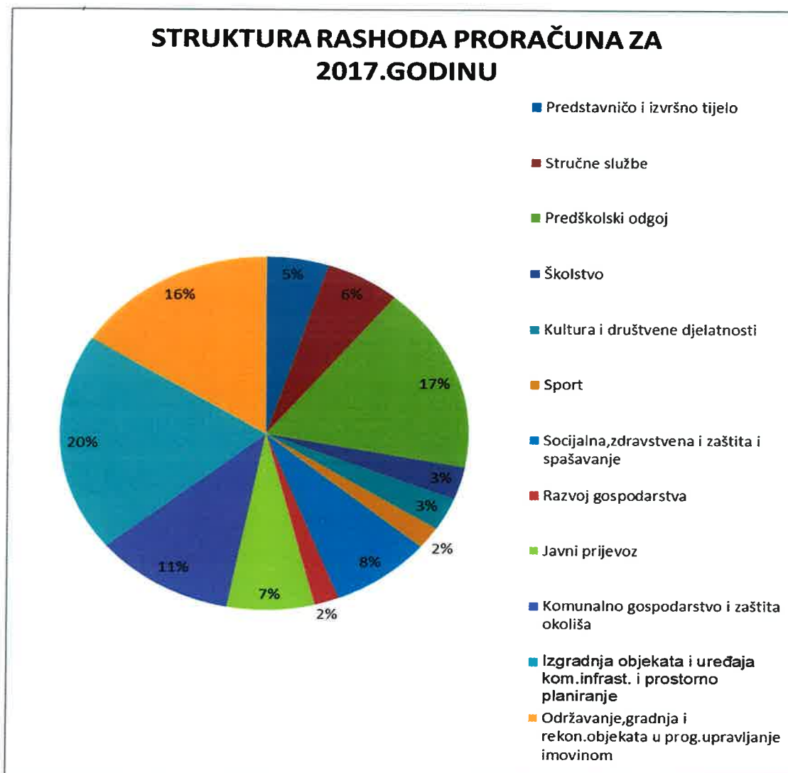
GRAFIKON 3: STRUKTURA RASHODA U POSEBNOM DIJELU PRORAČUNA ZA 2017.GODINU

U strukturi rashoda prema programskoj klasifikaciji u Posebnom dijelu Proračuna za 2017.g. najveći dio otpada na rashode za izgradnju objekata i uređaja komunalne infrastrukture i prostorno planiranje u iznosu od 20,0%, rashodi za predškolski odgoj 16,5%, rashode i izdatke za održavanje, gradnju i rekonstrukciju objekata u programu upravljanja imovinom 15,7%, te rashodi za tekućeg održavanja komunalne infrastrukture i zaštite okoliša 11,3%. Sveukupno se na navedene rashode odnosi gotovo dvije trećine ili 73,5%