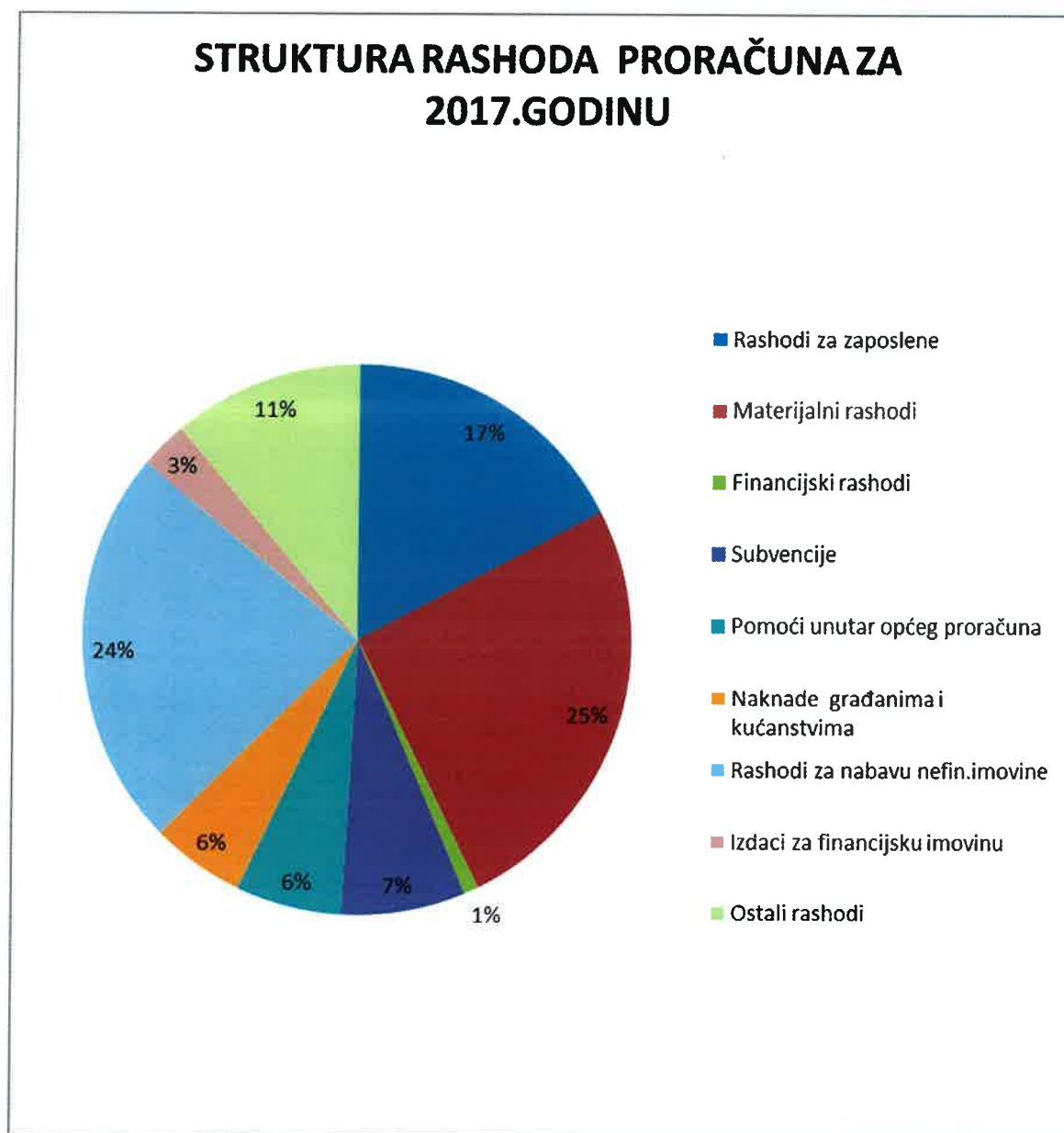
GRAFIKON 2: STRUKTURA RASHODA

U strukturi rashoda konsolidiranog proračuna za 2017.g. najveću udio imaju materijalni rashodi 25,5%, unutar kojih najveći dio otpada na rashode tekućeg održavanja objekata i komunalne infrastrukture općine i materijalne izdatke vrtića, rashodi za nabavu nefinancijske imovine 23,5%, rashodi za zaposlene 17,3% unutar kojih najveći dio otpada na rashode za plaće djelatnika Dječjeg vrtića (67,2%), te ostali rashodi 11,1% koji se odnose na transfere i donacije građanima i kućanstvima, kapitalne pomoći i donacije. Na navedene rashode odnosi se 77,4% ukupnog proračuna.